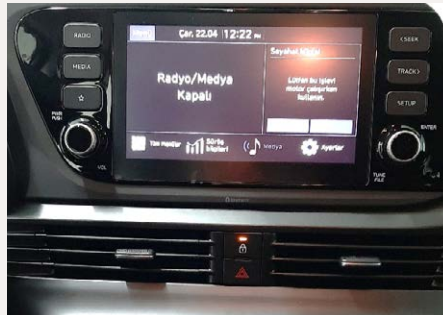
8"-os Display audio rendszer