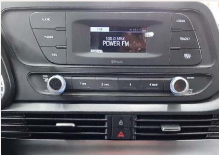
3,8"-os integrált audio rendszer