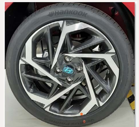
17"-os könnyűfém keréktárcsa