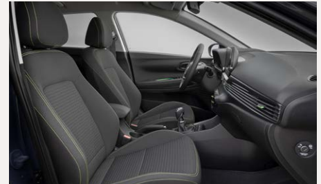
Black and Yellow belső - Comfortól