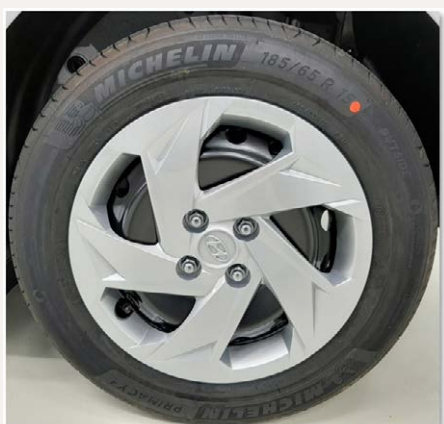
15"-os acélkerék díztárcsával