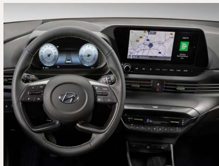
Supervision 10,25", és Navigációs 10,25" színes kijelzők