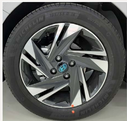
16"-os könnyűfém keréktárcsa