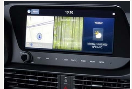
10,25"-os Navigációs rendszer